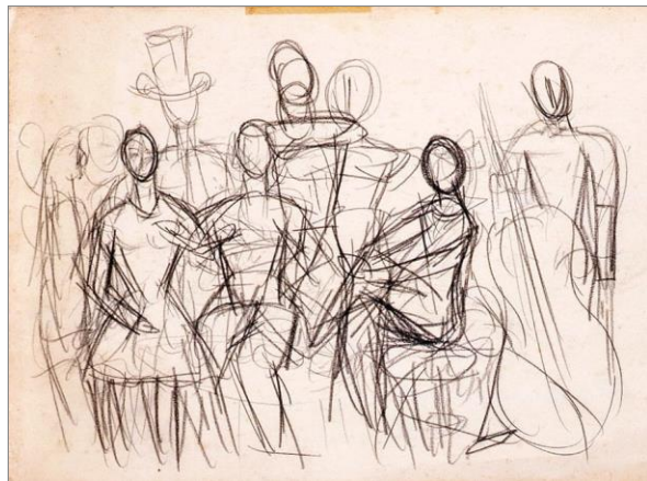
三岸好太郎「風景」1932年頃(裏面)