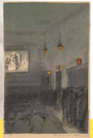
織田一磨《シネマ銀座(画集銀座の内)》 1929年

主催／北海道立三岸好太郎美術館 協力／河村泳静氏、伊達市教育委員会、特定非営利活動法人噴火湾アートビレッジ