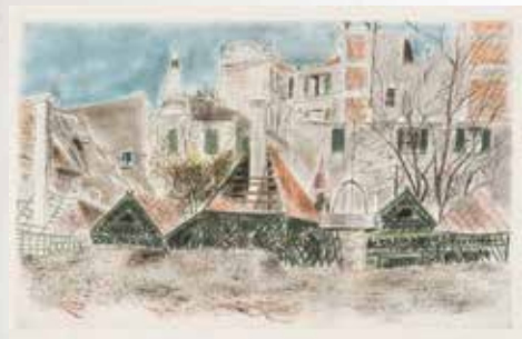
猪熊弦一郎《「パステル風景画集」より アルパツトレイネー(バリ)》 1939～40年頃