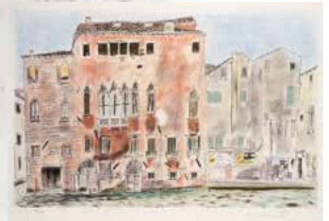
猪熊弦一郎《「パステル風景画集」より 古い家(ベニス)》 1939～40年頃 ©The MIMOCA Foundation 作品はいずれも河村泳静氏蔵(伊達市教育委員会寄託)